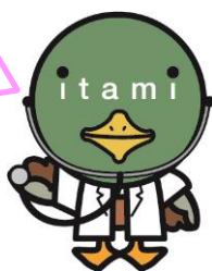
伊丹市マスコット たみまる

呼吸器外科を中心とした3 名の医師が肺がんに関する 病気・診断・治療などについて お話します！